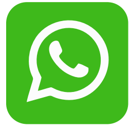
NRI ग्राहको वोट्सअप द्वारा