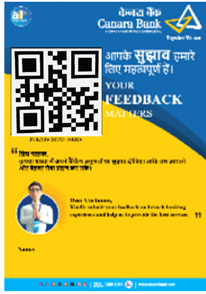
कर्मचारी विशिष्ट QR कोड (दरेक कर्मचारीना डेस्क पर उपलब्ध)