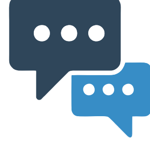
व्यक्तिगत / नोन-कोर्पोरेट ग्राहको SMS द्वारा