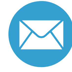
कोर्पोरेट ग्राहको एमेल द्वारा