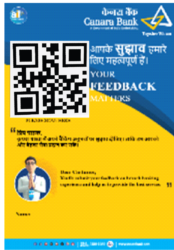
शाखा QR कोड-> (शाखा प्रमुख ना डेस्क उपर उपलब्ध)